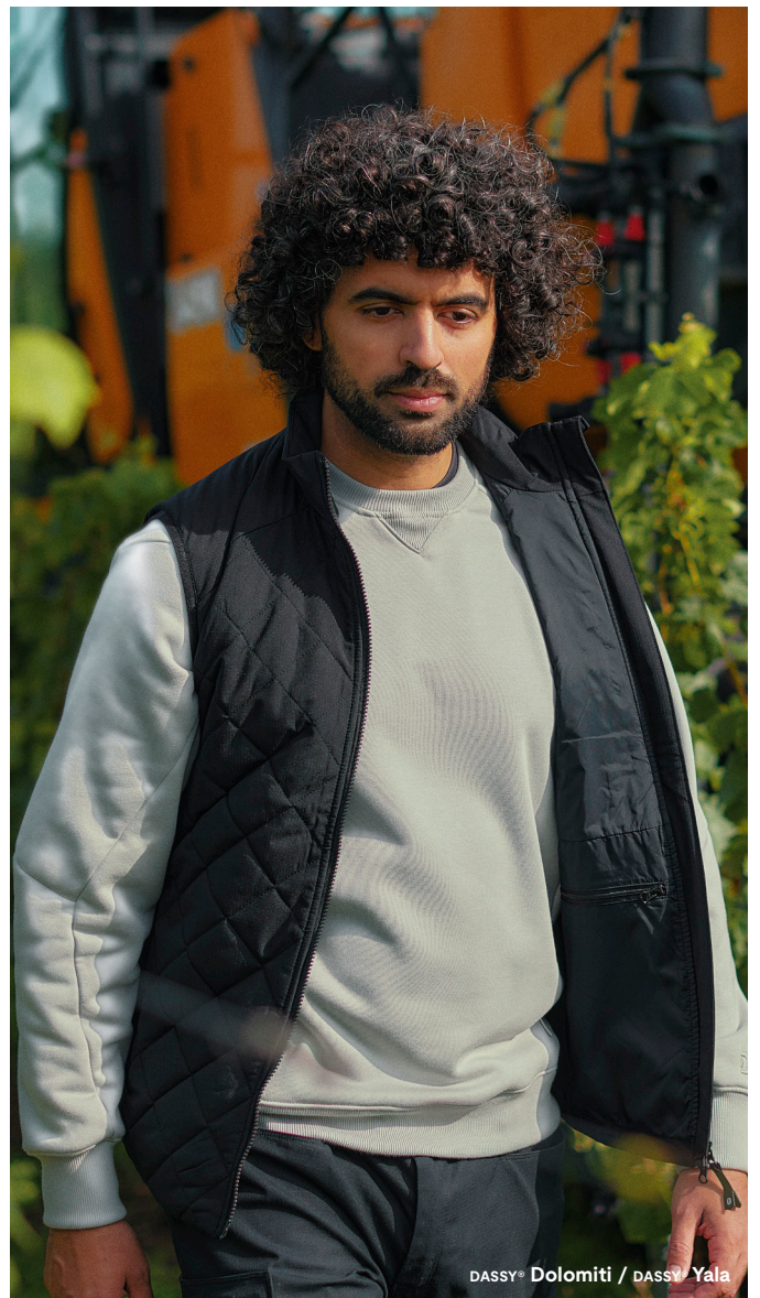
DASSY® Dolomiti / DASSY® Yala

Tragen Sie die Arbeitshose DASSY® Jasper mit unseren zertifizierten Kniepolstern Fide zu tragen. Für optimal geschützte Knie.