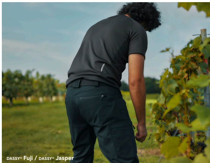
DASSY® Fuji / DASSY® Jasper